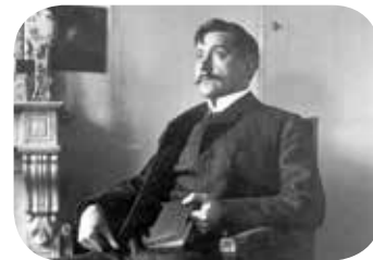
Maeterlinck in zijn ouderlijk huis in Gent circa 1890.