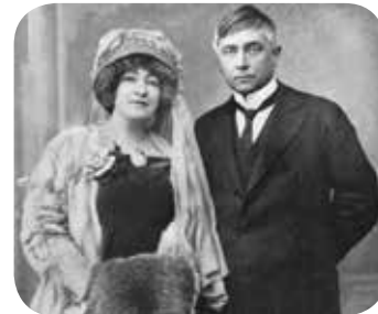
De jonge Maeterlinck met zijn muze Georgette Leblanc.