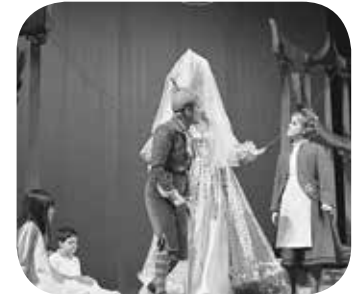
De fee Berylune met Tytyl et Mytyl, hoofdrolspelers in L'Oiseau Bleu

Benieuwd om het Gent van Maurice Maeterlinck ook al luisterend te ontdekken? Na Ons De Zondvloed en REC. creëerden een audiowandeling boordevol verhalen gebaseerd op de Blauwe Vogel. Met je neus in de wolken ontdek je de stad op een verrassende manier. De audiowandeling volgt dezelfde route als deze kaart en is te beluisteren via de gratis app De Blauwe Vogels. Vind de app via de QR-code, in de Play Store en de App Store.