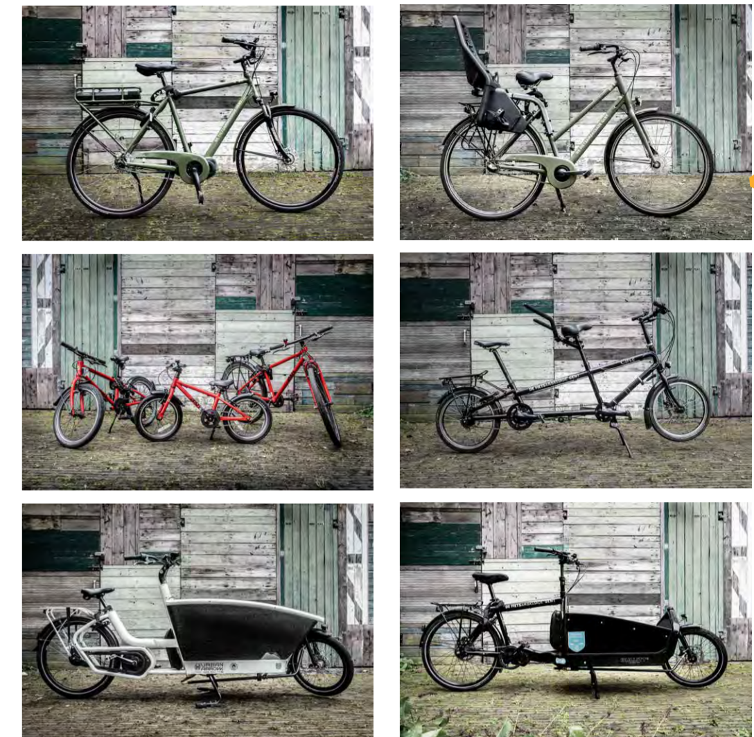
De Fietsambassade vzw, Boldermarkt 1, 9000 Gent

Below you can find a small selection of our rental offer for the whole family. In total we have 24 different models at your disposal in our Bike points. Please note that not every model is available in every location.