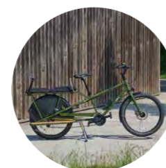
Longtail fiets - Longtail bike