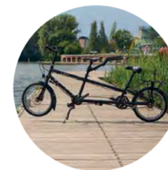
Tandem - Tandem