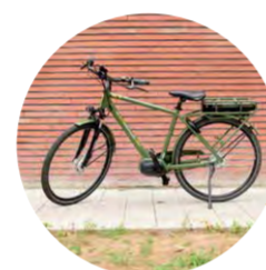
Elektrische fiets - E-bike