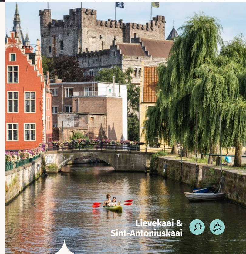
Lievekaai & Sint-Antoniusskaai

Para los amantes del agua 3 km - 40 min ★★★★★