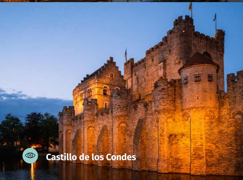
Castillo de los Condes