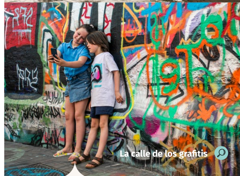
La calle de los grafitis