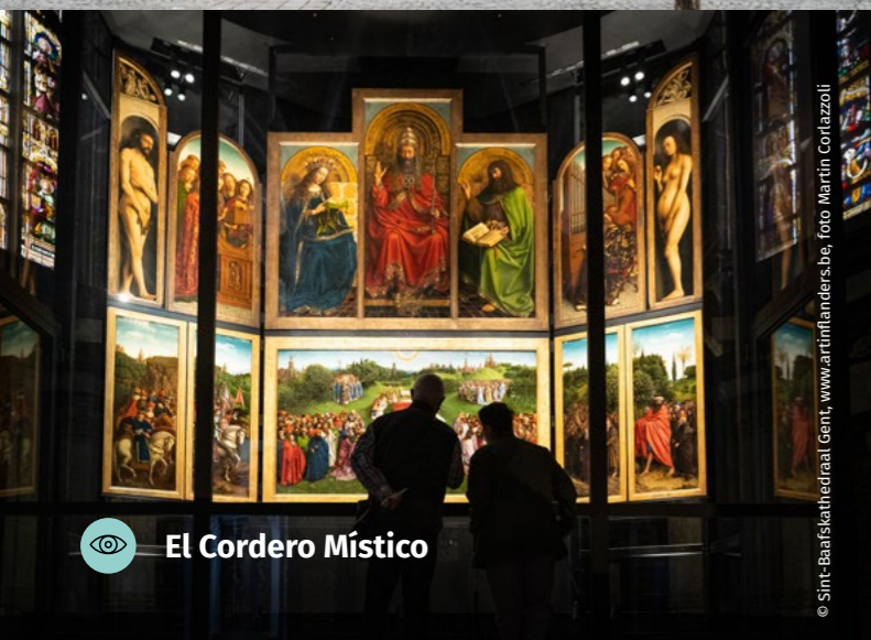
El Cordero Místico