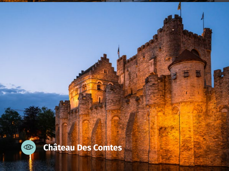
Château Des Comtes