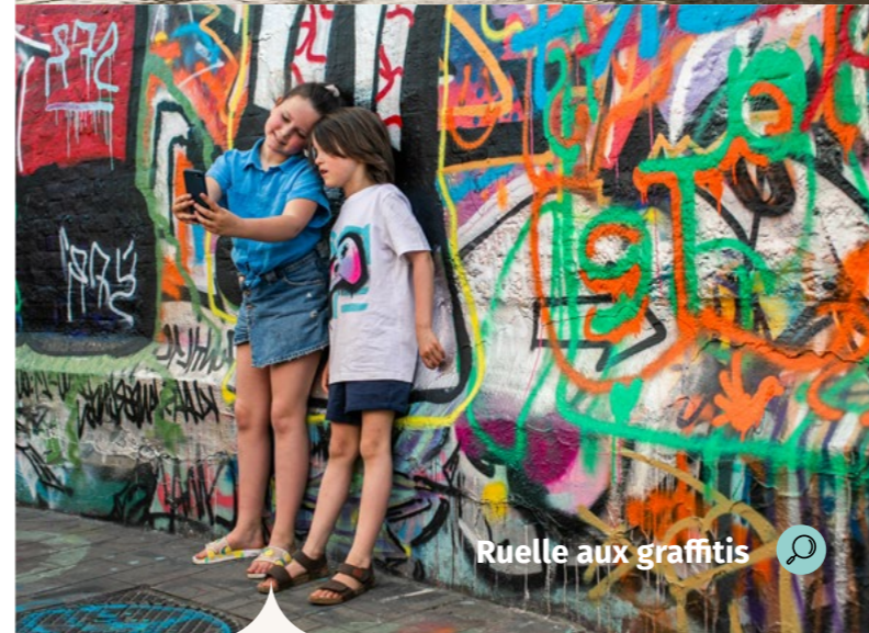
Ruelle aux graffitis